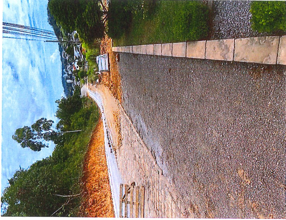
INDICAÇÃO DA LOCALIZAÇÃO ONDE DEVE DAR CONTINUIDADE O PASSEIO PÚBLICO (EXEMPLO)