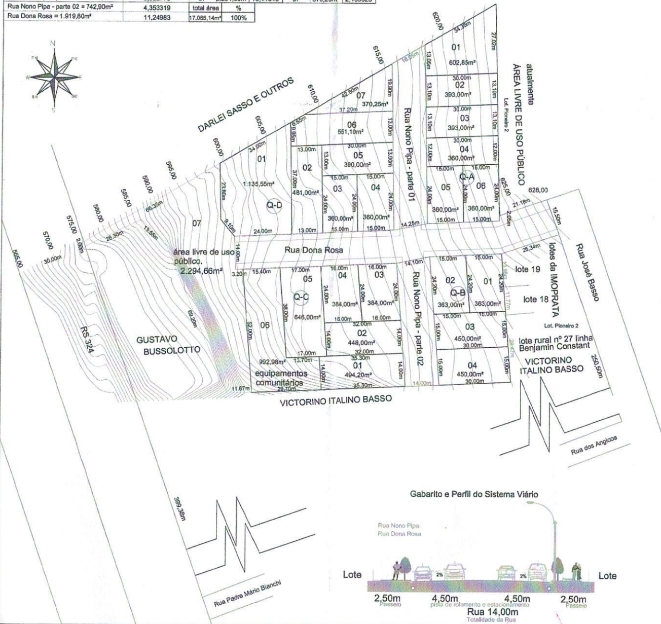
Gabarito e Perfil do Sistema Viário