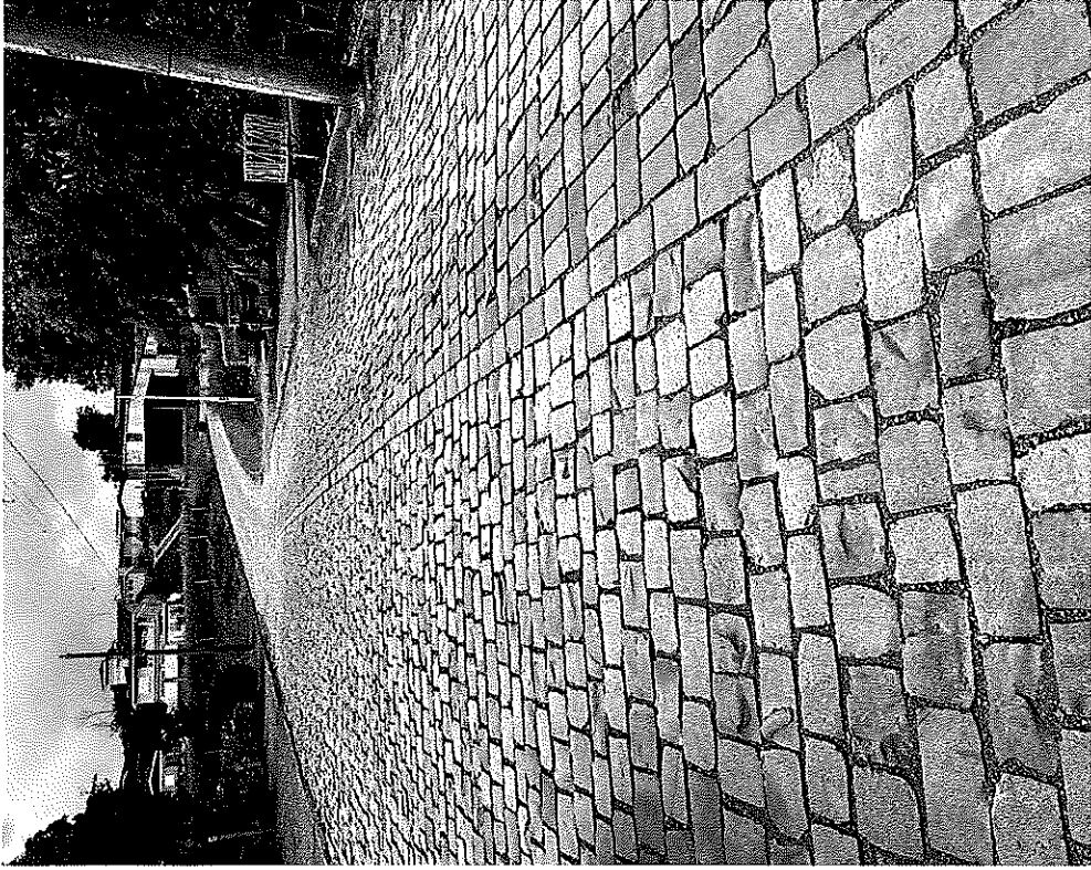
INDICAÇÃO DA LOCALIZAÇÃO ONDE DEVE SER INSTALADA A FAIXA DE SEGURANÇA ELEVADA E A PARADA DE ÔNIBUS