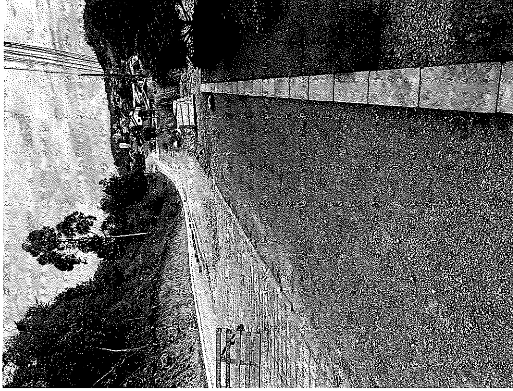
INDICAÇÃO DA LOCALIZAÇÃO ONDE DEVE DAR CONTINUIDADE O PASSEIO PÚBLICO (EXEMPLO)